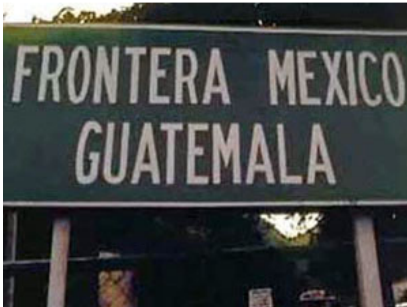
Pie de foto 6: Se trata de un tema de seguridad internacional

Hay quienes le apuestan al fracaso de las acciones contra el terrorismo, narcotráfico y la trata de personas. Quienes se oponen, son los verdaderos enemigos, los que están lucrando con el dolor ajeno, con envenenar a nuestros pueblos, con infundir el odio... estamos a tiempo de frenarlos, es la responsabilidad de los gobiernos, pero también es nuestra responsabilidad.