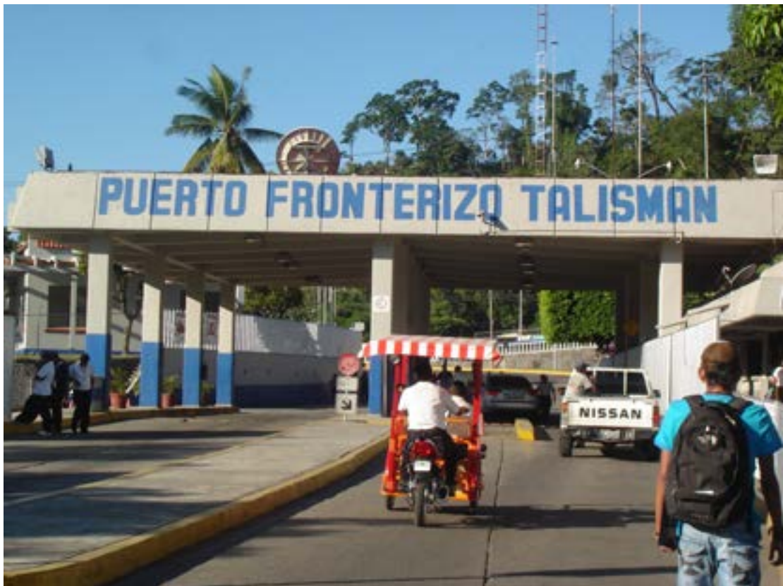
Pie de foto 4: Hoy la puerta tiene muchos candados... pero todas las ventanas están abiertas.

La propuesta de eliminación de Visa a guatemaltecos contempla que para ingresar a nuestro país, además de contar con un documento de identificación emitido por su país (pasaporte o similar), deberán brindar información sobre su estancia en territorio nacional –a dónde van y cuánto tiempo estarán-, así como el registro de sus huellas dactilares, datos biométricos y todo los procedimientos tecnológicos de seguridad con los que cuentan las agencias internacionales en la actualidad.