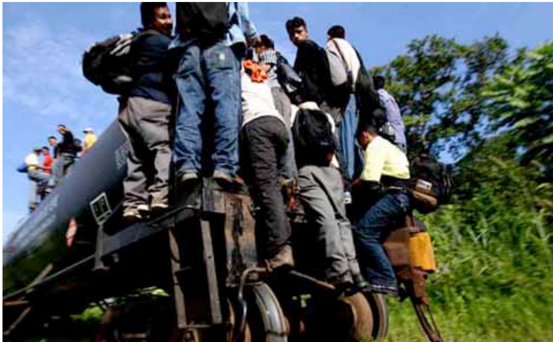
Pie de foto 3: En Chiapas se han logrado desarticular más de 23 bandas dedicadas a la trata de personas y el secuestro de emigrantes

El reciente rescate de más de 500 emigrantes se logró gracias a la tecnología de Rayos X con la que dispone el gobierno de Chiapas. Se trata de unos vehículos capaces de revisar el interior de las unidades que transitan en las carreteras. Aunado a ello, se cuenta con otros dispositivos que han demostrado su efectividad en países como Estados Unidos y otros de Europa para la prevención de delitos. En pocas palabras: tecnología aplicada en el combate a la delincuencia y el terrorismo.